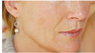
nach 2 Behandlungen

(Alle Aufnahmen in dieser Broschüre erfolgten unter professionellen Bedingungen und wurden nicht retuschiert.)