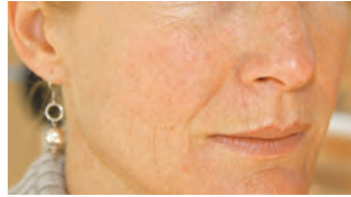
nach 2 Behandlungen